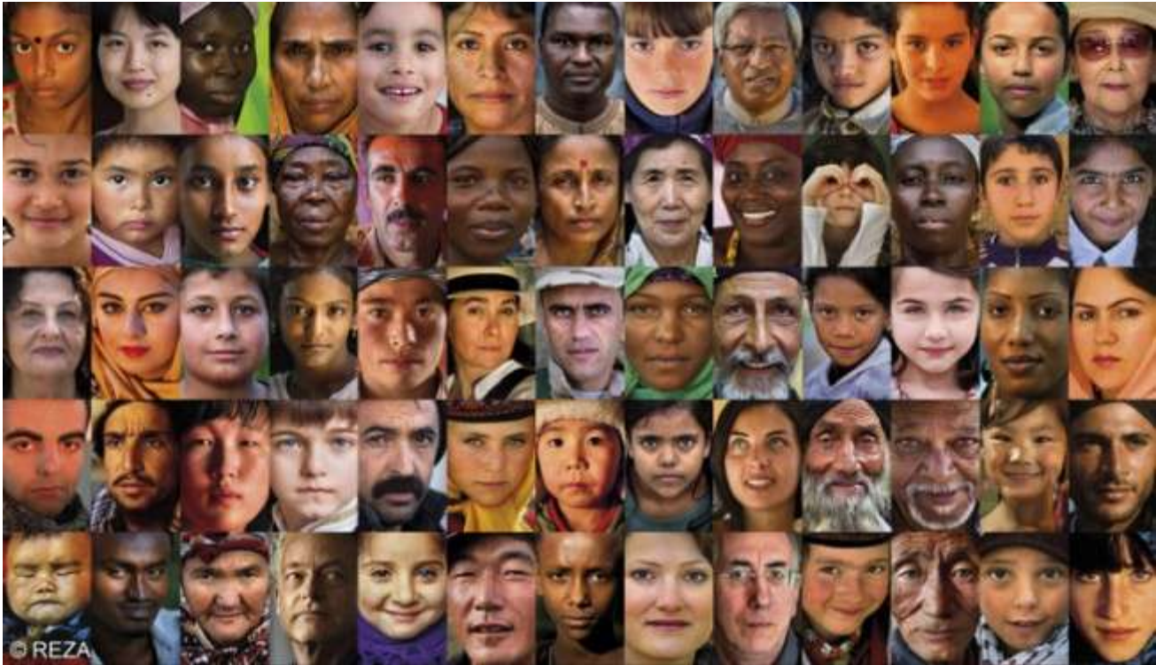
Mosaïque Reza

Ce projet a pour but de faire réfléchir sur la notion de fraternité